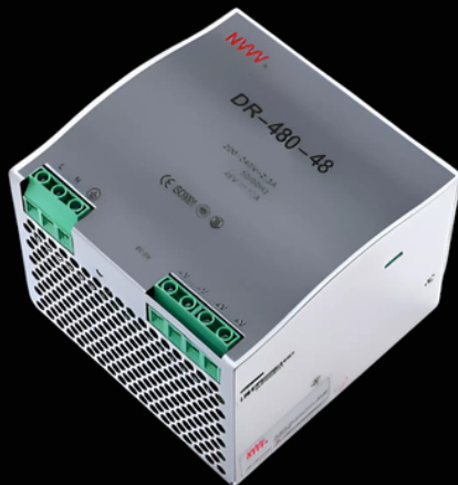
Industrial Power Supply