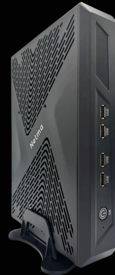
PC con placa de Video para Render, Autocad