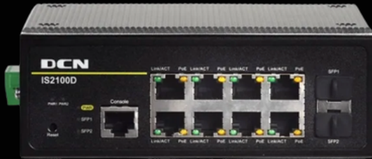
Switches Industriales PoE+ 10/100/1000