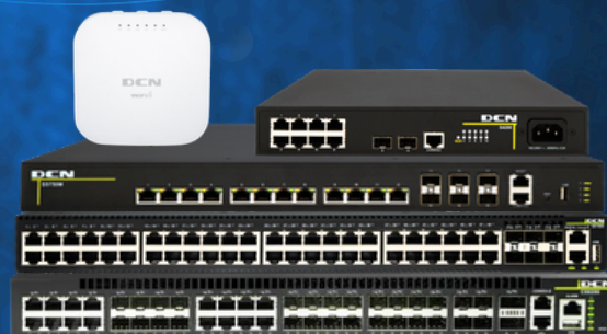
Firewall y equipos de Networking

Alquileres anuales y temporales por proyectos